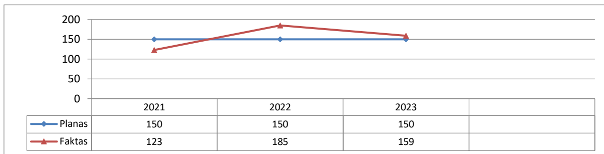
3 grafikas. Pravestų edukacinių užsiėmimų skaičius (vnt.)