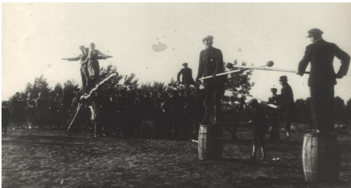
Atrakcionai ant Graužikų kalno per Joninių šventę.