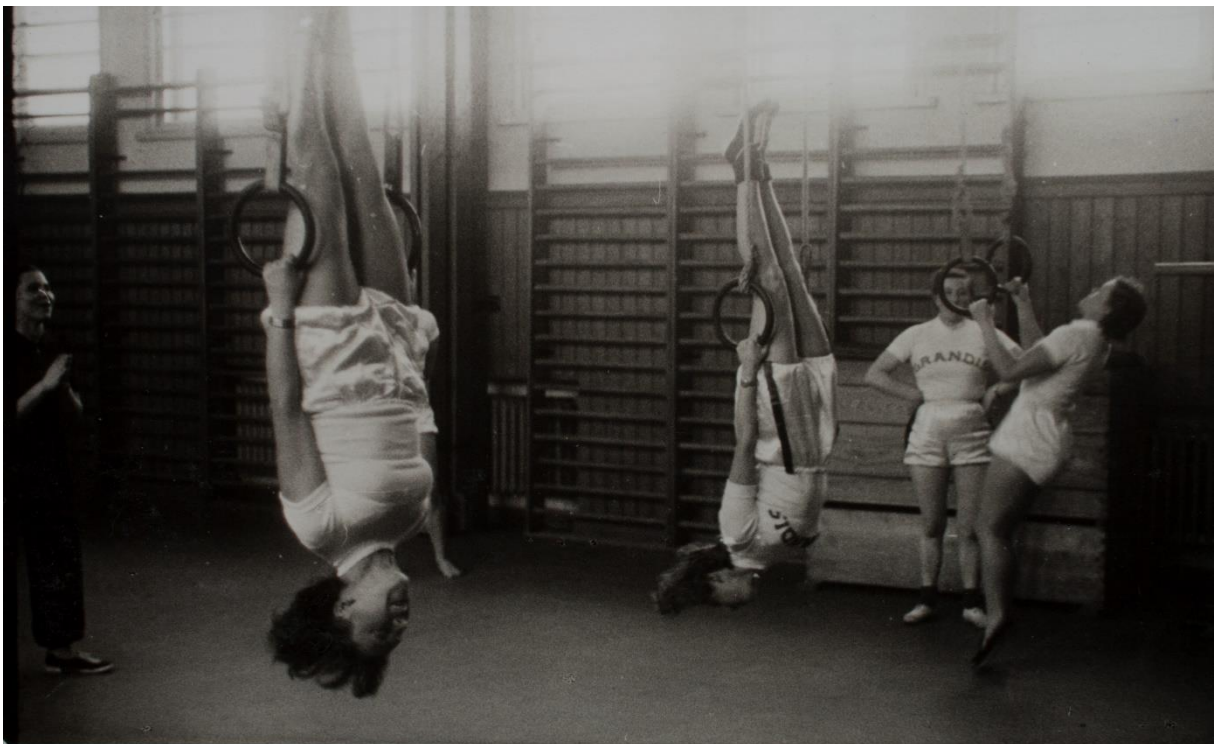
Lietuvos Šaulių sąjungos rinktinių moterų šaulių sporto vadovių kursai. Šaulės sporto salėje atlieka tempimo pratimus. Kaunas, 1940 m. sausio 2–4 d.