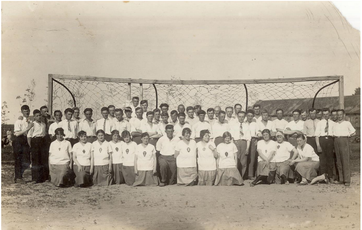
Kauno Šaulių sąjungos sporto sekcijos futbolo komanda. Kaunas, 1924 m.