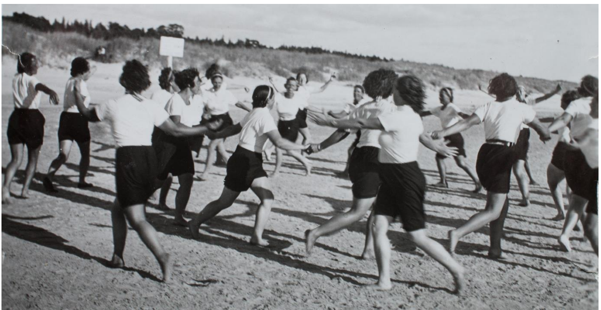
Lietuvos Šaulių sąjungos šaulės šaulių moterų stovykloje sporto užsiėmimų metu. Šaulės pajūryje mankštos metu. Palanga, 1937 m.