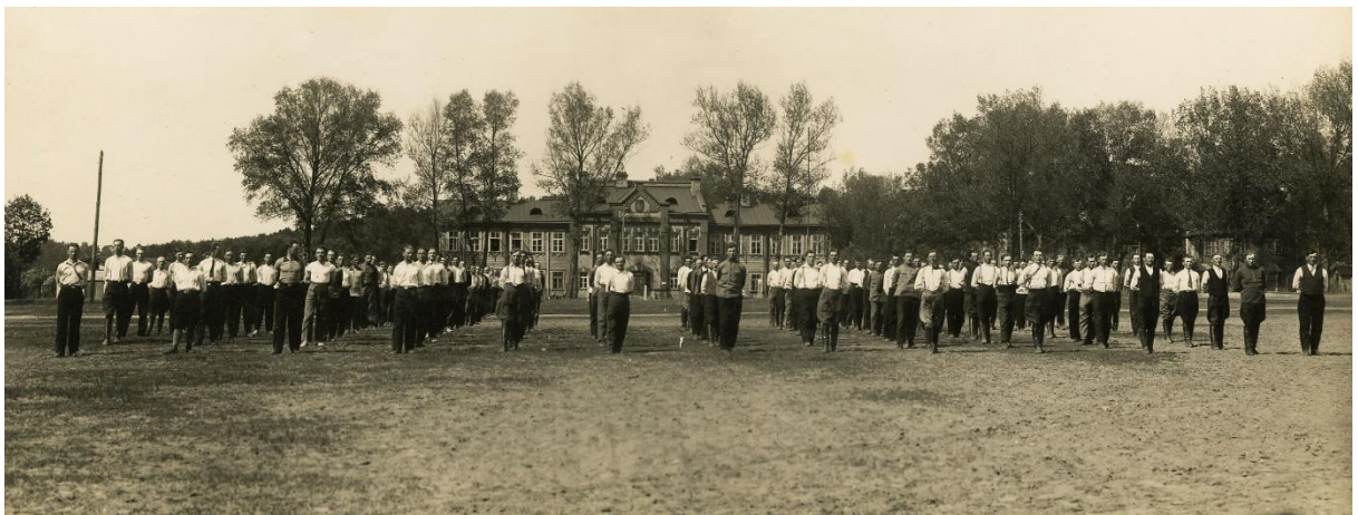
Lietuvos Šaulių sąjungos šauliai pasiruošę treniruotei. XX a. 3 deš.